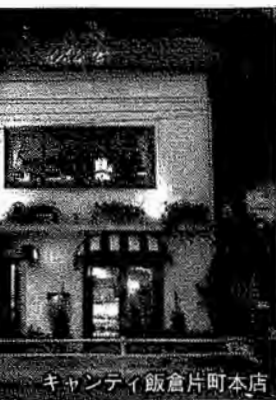
キャンテイ飯倉片町本店

通したのは同年。渋谷と新橋を結んでいた都電6系統は、首都高速3号渋谷線が供用開始の昭和42年に撤去され、外苑東