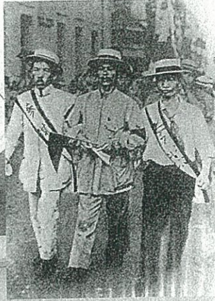
1921年、川崎・三菱造船所の労働争議を指導して賀川豊彦はデモの先頭に立ち、官憲に拘束された